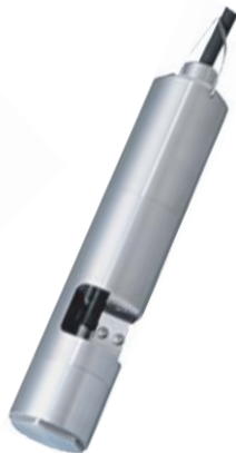
[ Turbidity / SS 센서 ]