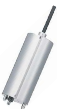
[ MLSS 센서 ]